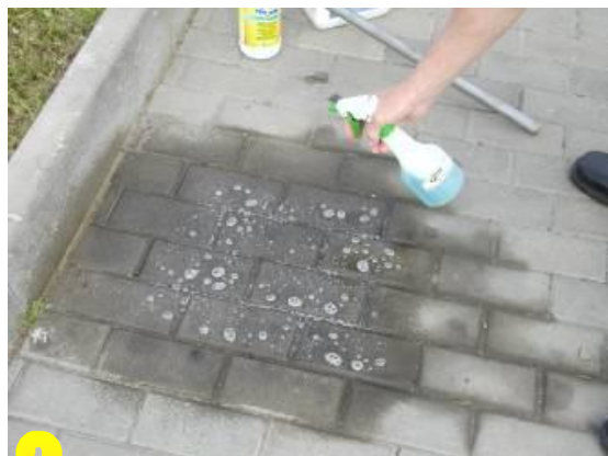
2 Skvrnu nechat po dobu 3 – 4 minut smočit odmašťovacím prostředkem THOR 91 nebo 100 USI (zvláště v případě asfaltového povrchu).