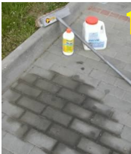
1 Příklad staré skvrny: Několik let starý olej.